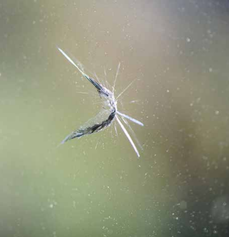
Här är ytterutan skadad och då är det Kungälvsbostäders ansvar. Hyresgästen ansvarar för innerrutan.