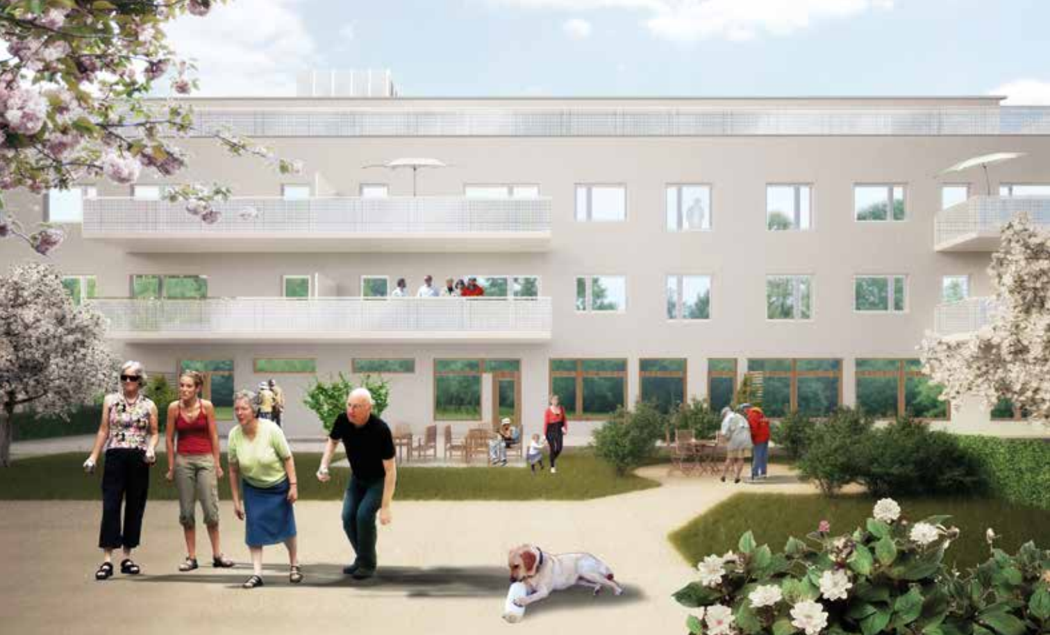
Så här är det tänkt att det nya seniorboendet i Komarken ska se ut.