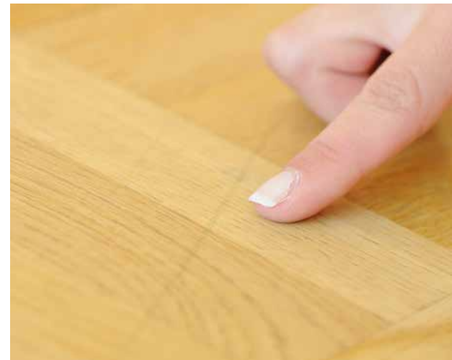
Här var det bara några mindre repor i parketten. Om det är fuktfläckor, grova repor eller andra skador får hyresgästen betala för slipning och lackning.