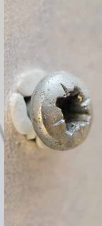
Dekaler på kakelplattor och andra ställen ska tas bort. Några märken efter krokare och pluggar finns nästan alltid. Är det många hål och stora fläckar eller andra skador får hyresgästen vara beredd att betala för onormalt slitage.

.....➔ TEXT: KENTH LÄRK